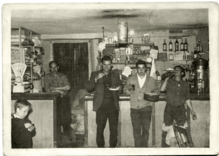
Na cantina de San Xusto. 1960-1962